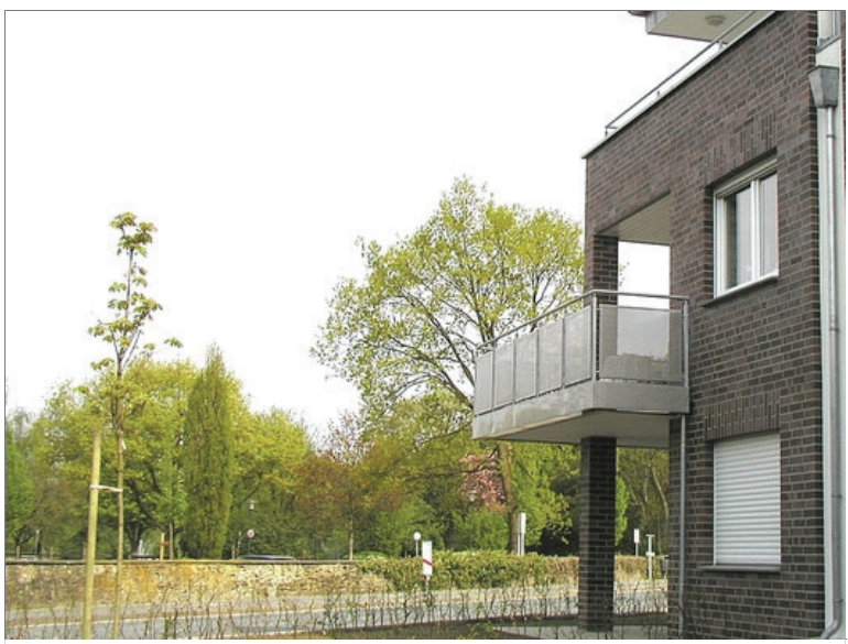
Am Kurpark in Bad Laer ist eine Anlage für das betreute Wohnen entstanden.