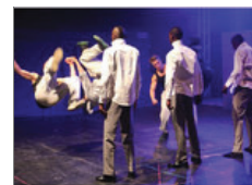
Afrika-Festival: „TOS meets Corrobation“ im ehemaligen