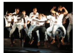
Beeindruckendes Afro-Theater aus Münster (6)