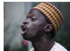
Das kleine Fest im Heger-Tor-Viertel (14)