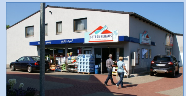
Umgebaute Marktpassage in Ostercappeln.