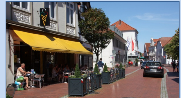
Mehr Aufenthaltsqualität und beruhigter Verkehr: Innenstadt für ALLE in Quakenbrück.