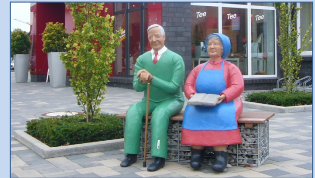
Figures beleben den Ortskern von Neuenkirchen – vor der neuen Immobilie mit Geschäft und Café.