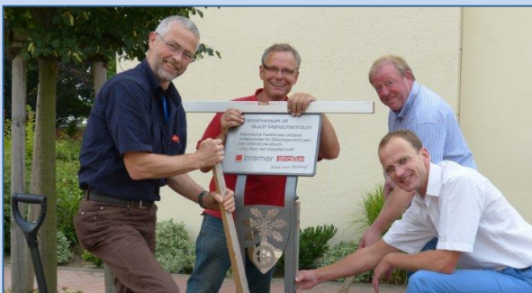
Neue Infotafeln in Bohmte – mit dem neuen Logo „Bremer Straße – Genau meine Richtung!“

Wie lassen sich die Akteure vor Ort begeistern, wie können Immobilien bewegt werden? Darüber möchten wir mit Ihnen und den Akteuren vor Ort diskutieren. Informieren Sie sich aus erster Hand über erfolgreiche Strategien und Maßnahmen – auch für Ihren Ortskern!