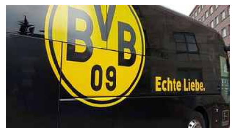
Zwischenquartier im Hotel Remarque