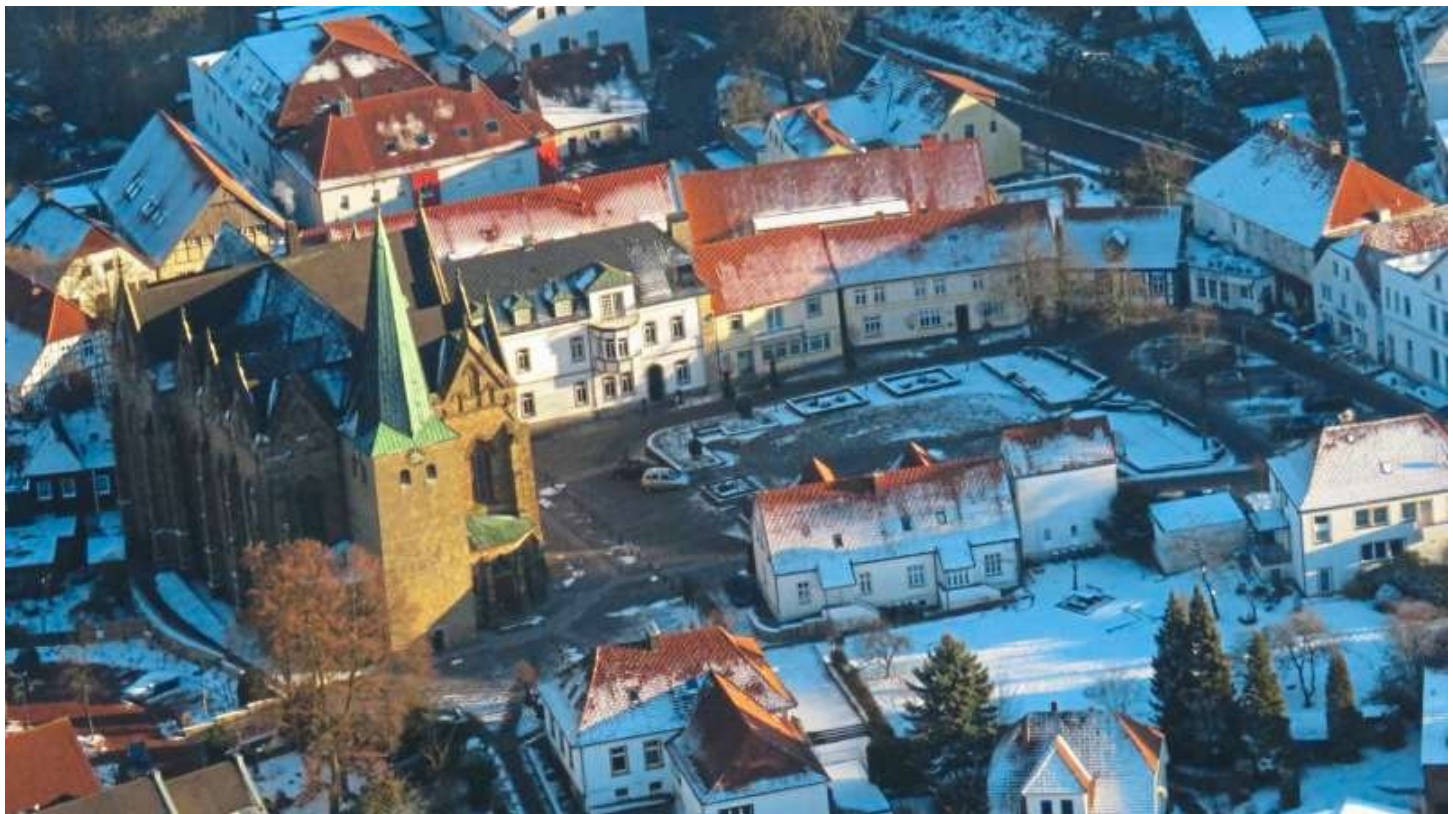
Winterlicher Blick auf das Ostercappeler Zentrum mit dem Kirchplatz und St. Lambertus.