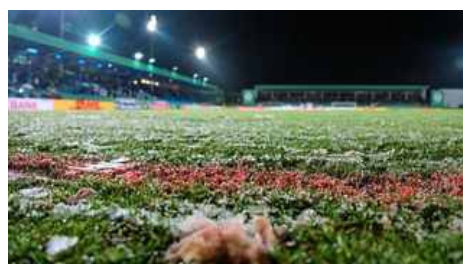
DFB-Pokalspielabsage gegen BVB