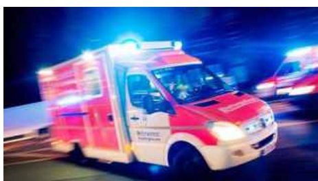
Mit geballten Fäusten